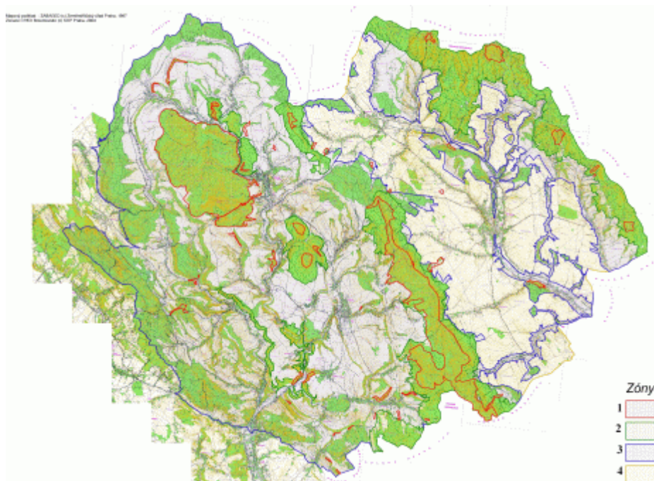
Mapa zonace CHKO Broumovsko byla schválena vyhláškou MŽP ČR č. 157/1991 Sb..