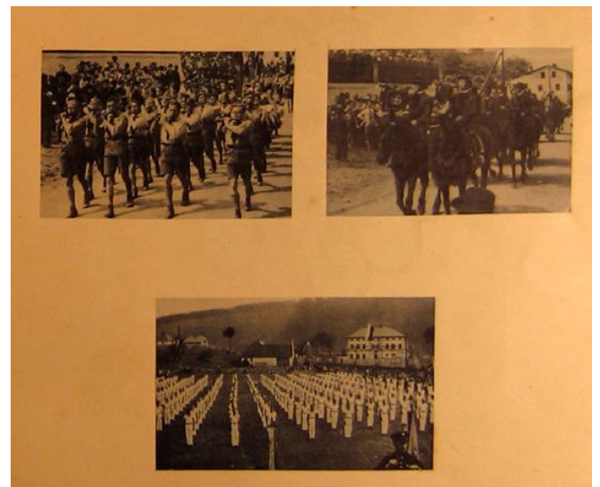
Župní tělocvičná slavnost 27. 28. července 1936 v Heřmánkovicích. Na snímku vpravo, za řadami cvičenců je budova bývalé hospody na křižovatce Olivětín, Heřmánkovice, Hynčice. Cvičiště bylo na místě dnešních pstružích sádek v Heřmánkovicích. Fotografie jsou z heřmánkovickej kroniky, tělocvičná župa vydala samostatný soubor fotografií.