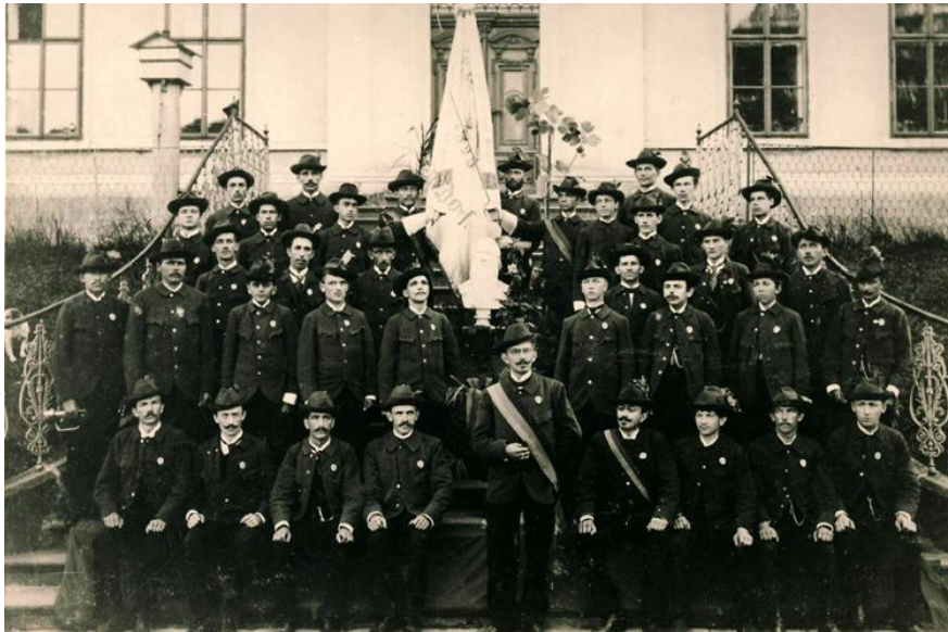
Turnverein Heřmánkovice se svým praporem na schodech před školou. Rok 1900